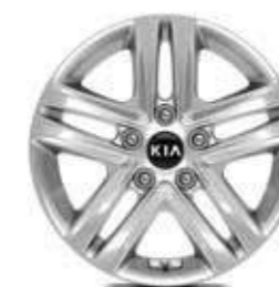
16" aluminium velgen met 205/55 banden