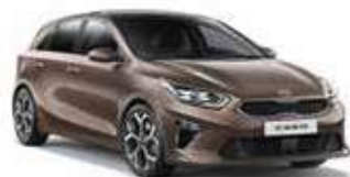
Copper Stone (L2B)