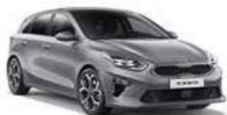
Lunar Silver (CSS)