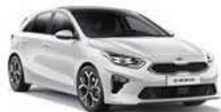
Deluxe White (HW2)