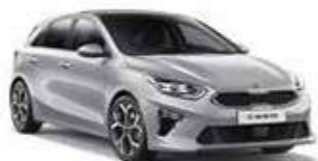
Sparkling Silver (KCS)