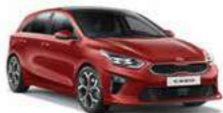
Infra Red (AA9)