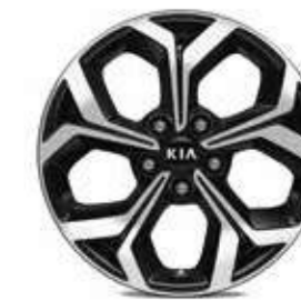
17" aluminium velgen met 225/45 banden (optioneel)