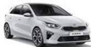
Cassa White (WD)**