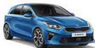
Blue Flame (B3L)